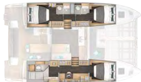
3 cabins, 3 heads / 3 cabines, 3 salles d'eau