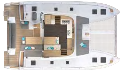
Salon & cockpit / Carré & cockpit 12 couverts