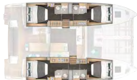
4 cabins, 4 heads / 4 cabines, 4 salles d'eau