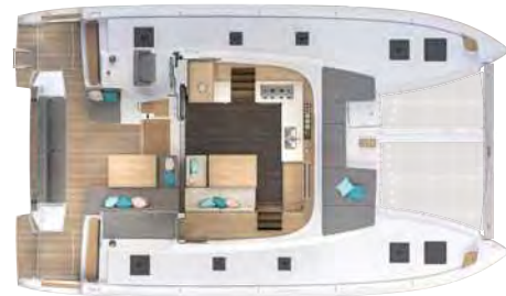
Salon & cockpit / Carré & cockpit 6 couverts