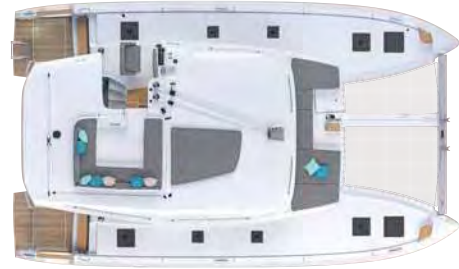
Flybridge & deck / Flybridge & pont